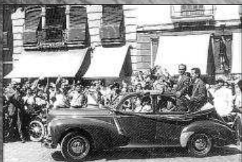
Umjubelte Heimkehr von Guillem Timoner nach dem Gewinn des Weltmeistertitels 1964 (oben). Unten: Der sechsfache Steher-Weltmeister aus Felanitx in Aktion.